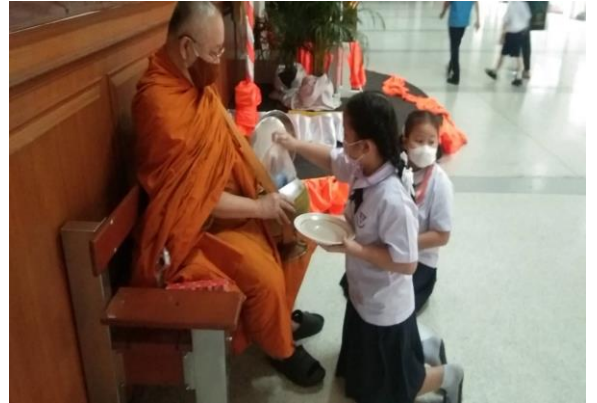
นักเรียนทำบุญตักบาตรทุกเช้าวันพฤหัสบดี