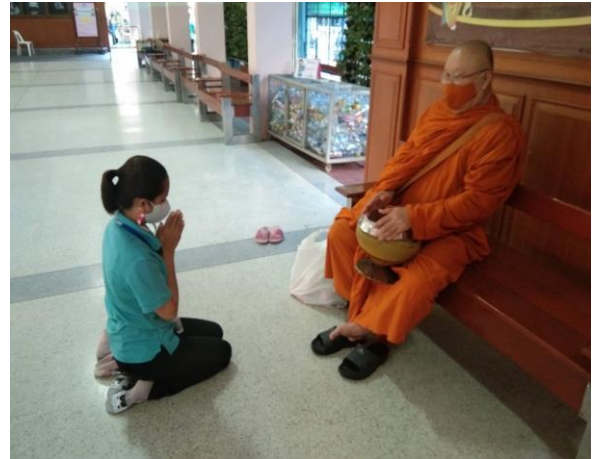
คณะครูร่วมทำบุญตักบาตรทุกวันพฤหัสบดี