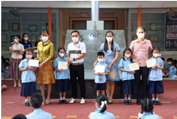
การประกวดมารยาทไทย