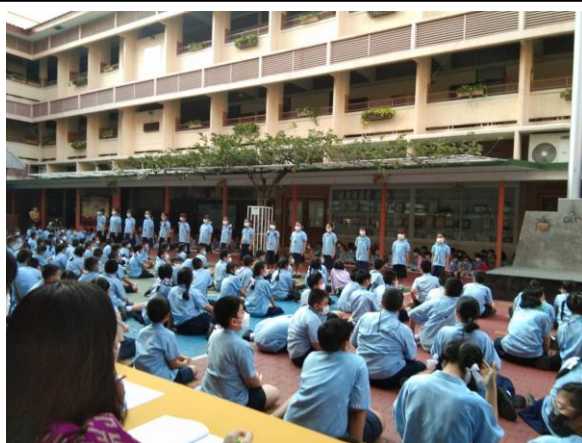
นักเรียนฝึกมารยาทไทยทุกวันศุกร์ และมีการจัด ประกวดมารยาท