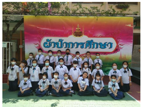
คณะผู้บริหาร ครู ผู้ปกครอง และนักเรียนจัด ผ้าป่าการศึกษาทุกปี