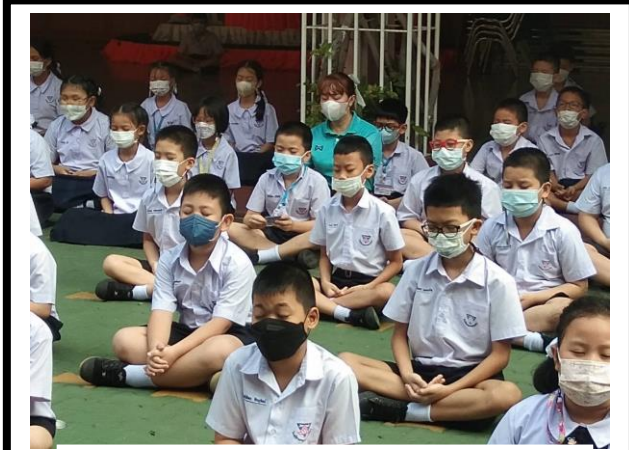
นักเรียนสวดมนต์ไหว้พระ นั่งสมาธิทุกวัน